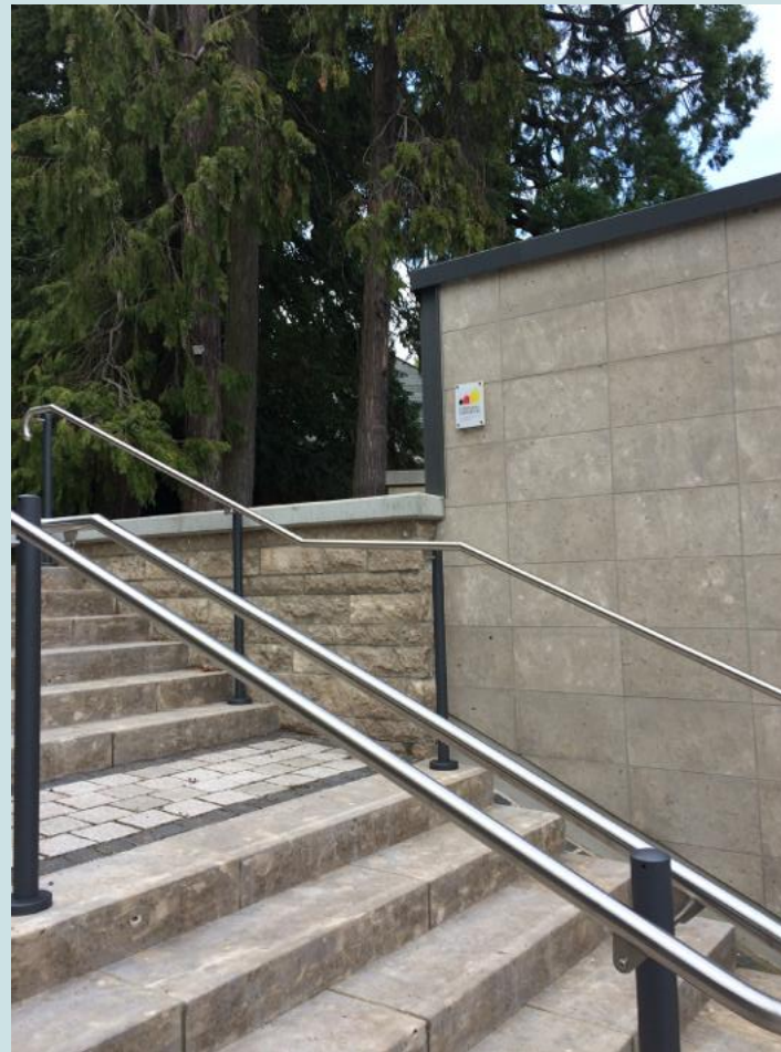
Treppenanlage nach Fertigstellung

Planung und Bauleitung: Architekturbüro Friedemann Oschmann