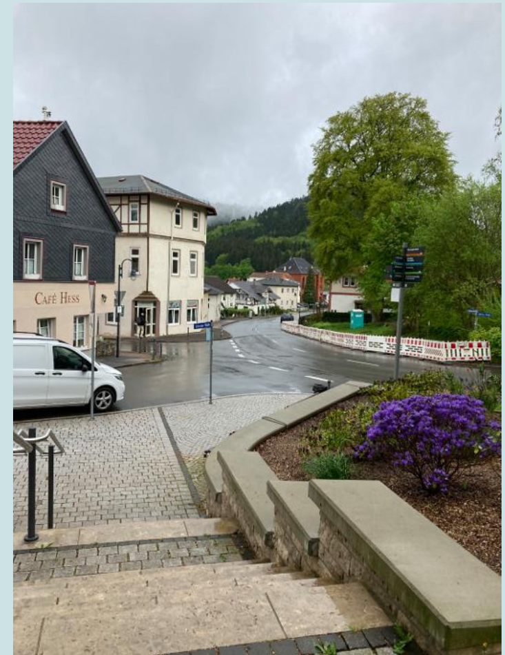
Treppenanlage nach Fertigstellung